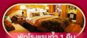
พักรวม 1 คืน