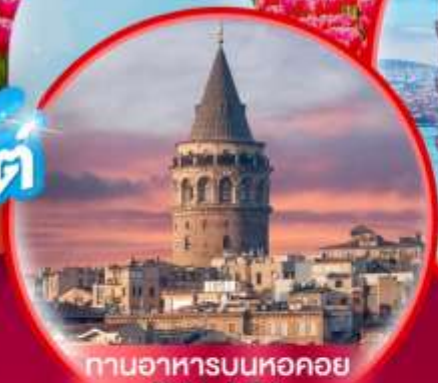
ทานอาหารบนหอคอย GALATA