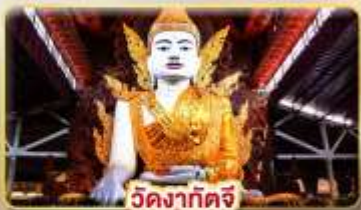
วัดงากัดจี