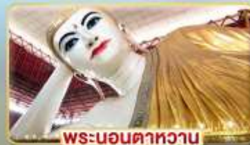
พระนอนคาทวาน