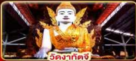
วัดงาทัดจี

สักการะ 3 มหาบุชาสถาน พักบนอินทร์แวน 1 คืน