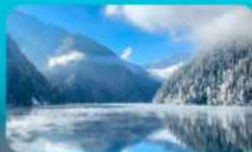
จี๋จ้ายโกว