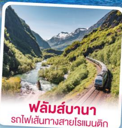
พลิမ်ส์บานา รถไฟเส้นทางสายโรแมนติก