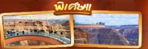
ชมความยิ่งใหญ่ของ GRAND CANYON WEST SKYWALK