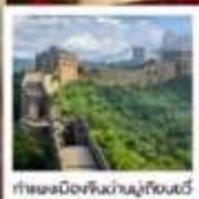
กำแพงเมืองจีน/หุบเขาเทียนถัน