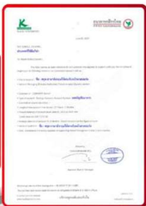
ตัวอย่าง Bank Guarantee ที่ผู้สมัครต้องเตรียมมา