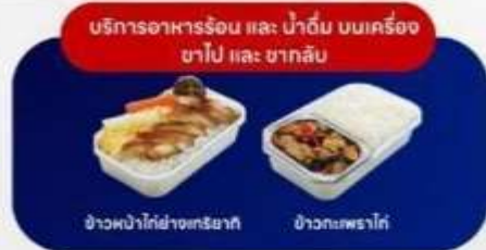
บริการอาหารร้อน และ น้ำดื่ม บนเครื่อง ขาไป และ ขากลับ