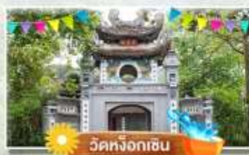
วัดหังอกเซิน