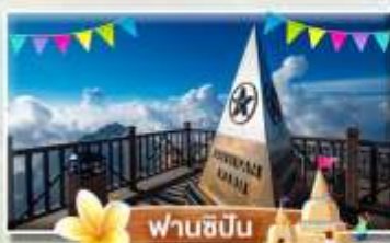
ฟานซีปัน