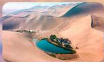
เหมินทรายหมิงซาซาน