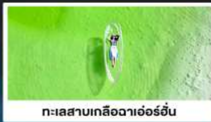
ทะเลสาบเกลือดาเอ๋อร์อัน