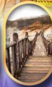
หุบเขาจิกุกดาบิ