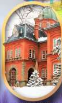
ศาลาว่าการฮอกไกโด