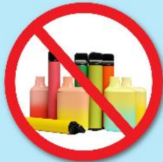
ปืนไฟฟ้า บุหรี่ยาสูบ