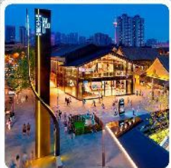
ถนนคนเดินไท่กุ๋หลี่