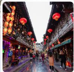
ถนนโบราณจิ้นหลี่