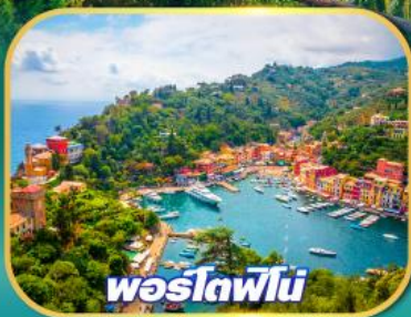
พอร์ตอฟินอ