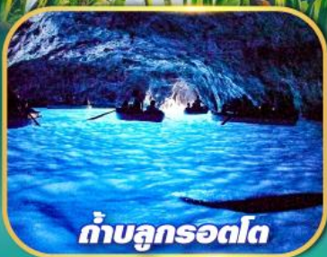
ถ้ำบลูกรอตโต