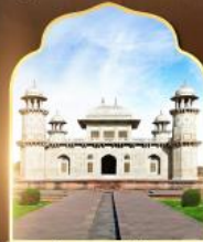
ทักษมาฮาลน้อย