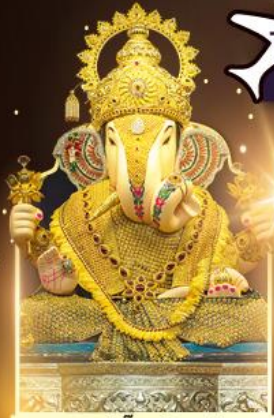
องค์ดีกษุท์พิเศษผู้