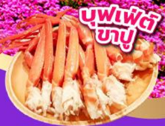
บุฟเฟ่ต์ ขาปู