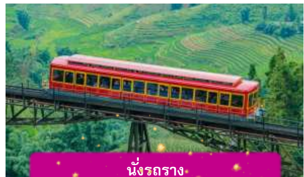
นั่งรถราง

เที่ยง บริการอาหารกลางวัน ณ ภัตตาคาร พิเศษ ... เมนูบุฟเฟ่ฟานซีปัน