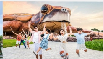
วินเพิร์ล อควาเรียม

*ทางบริษัทฯ ขอสงวนสิทธิ์ในการสลับโปรแกรมทัวร์ตามความเหมาะสมขึ้นอยู่กับสถานการณ์หน้างาน โดยคำนึงถึงผลประโยชน์ของลูกค้าเป็นสำคัญ