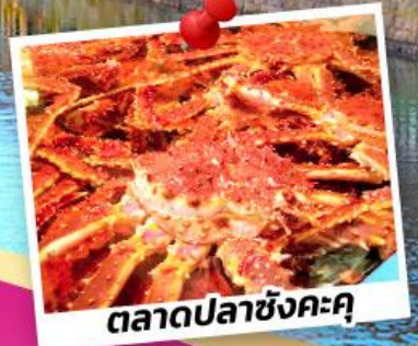
ตลาดปลาซังคะคุ

ชมสวนดอกไม้ ชิชิโซโนะโอะกะ ชมความงดงามของน้ำตกชิโรอิเงะ