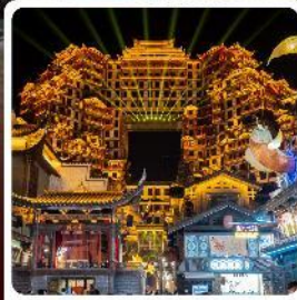
ตึกมหัศจรรย์ 72