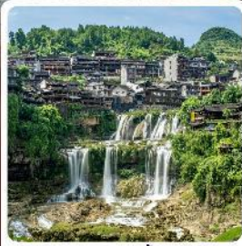
ฟูหลงเจิน