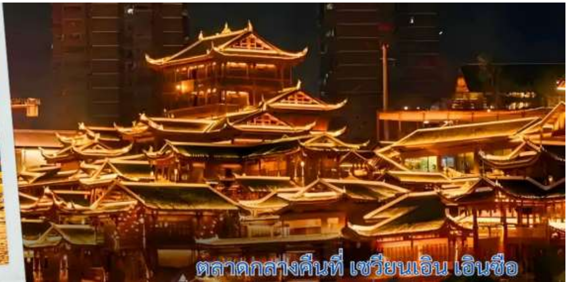
ตลาดกลางคืนที่ เซวียนเอน เอนซือ