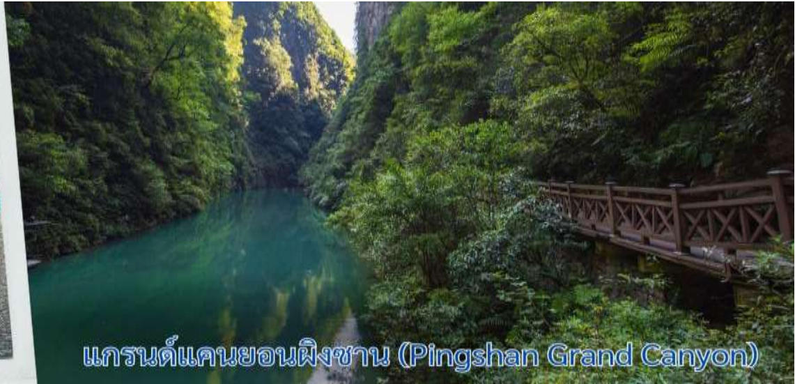
แกรนด์แคนยอนผิงซาน (Pingshan Grand Canyon)