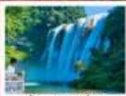
น้ำตกหวงกั๋วซู