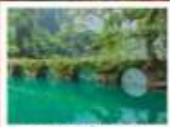
อุทยานสี่ผิงชิว