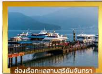
ล่องเรือทะเลสาบสุริยอินจินทรา