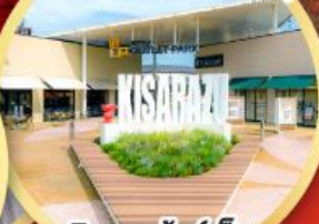
มิตซึย เอ้าท์เล็ต พาร์ค คิชะระชู