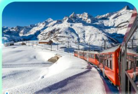
นั่งรถไฟสู่ยอดเขารอนเนอ์เกรต