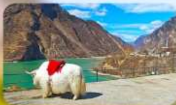
กะเลสาบเต๋อซี