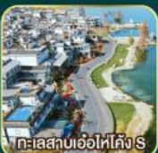
ทะเลสาบเอ๋อไห่คัง S