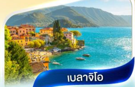
เบลลาจีโอ