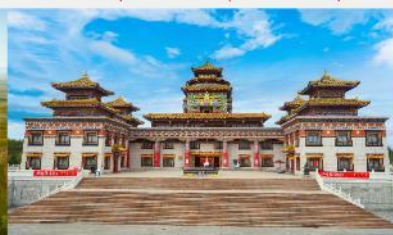
ทำเนียบพระลามะอุหลาน