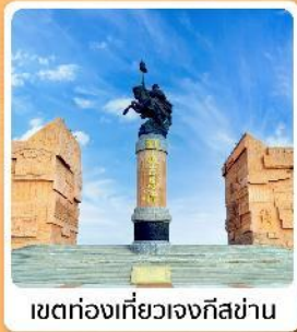
เขตท่องเที่ยวเจงกิสข่าน