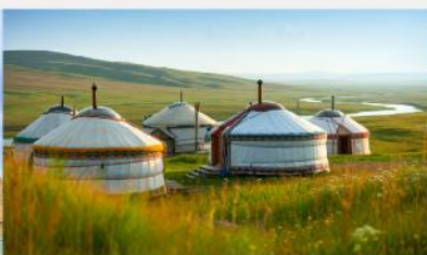
ที่พักแบบกระโจม