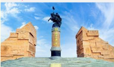
เขตท่องเที่ยวเจงกิสข่าน