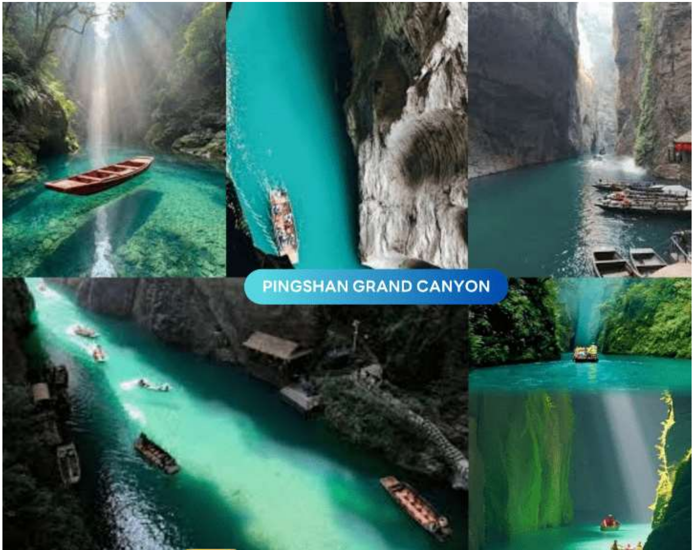
PINGSHAN GRAND CANYON

นำท่านออกเดินทางสู่ หุบเขาผิงซาน (Pingshan Canyon) สัมผัสประสบการณ์การล่องเรือเข้า-ออก เพื่อเพลิดเพลินกับธรรมชาติภายในหุบเขาและบนผืนน้ำที่ได้รับการขนานนามว่า "ใสที่สุดในประเทศจีน" ด้วยความใสสะอาด ทำให้ท่านสามารถมองเห็นเงาสท้อนของเทือกเขาและท้องฟ้าบนผืนน้ำได้อย่างแจ่มชัด จนดูราวกับว่าเรือกำลังลอยละล่องอยู่กลางอากาศ ( ราคาล่องเรือรวมในราคาทัวร์ )