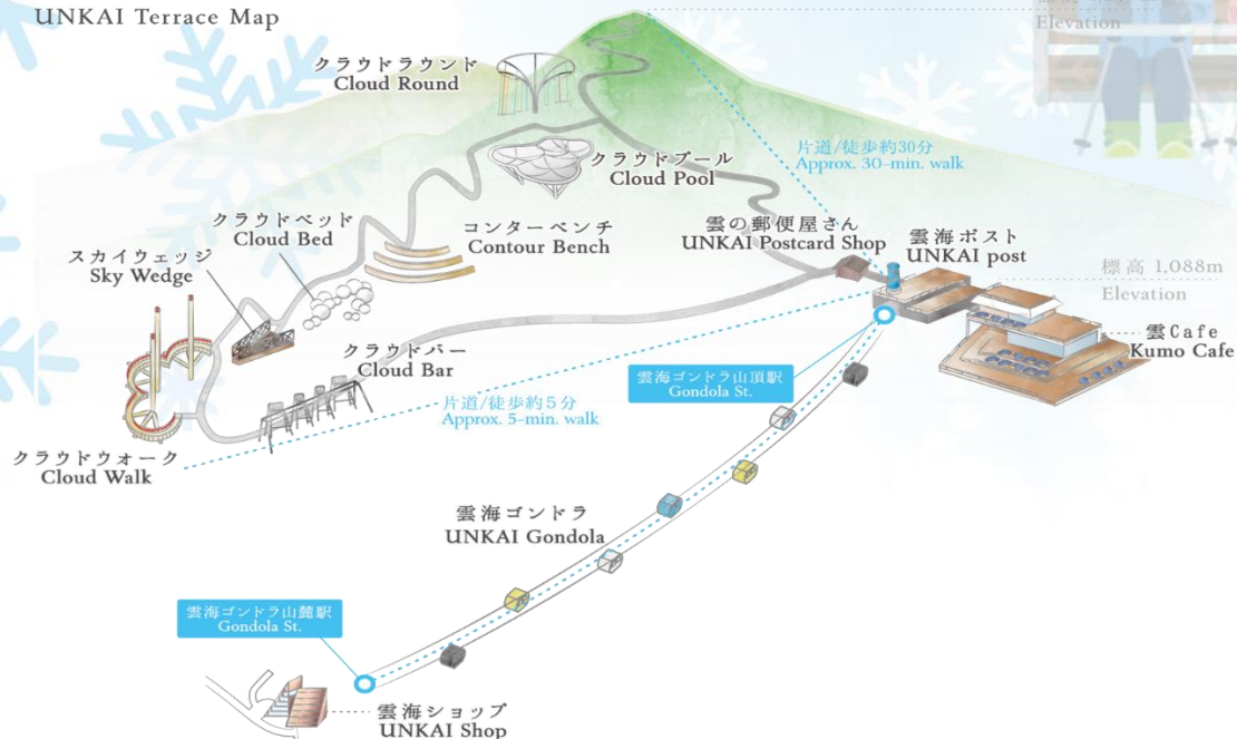
雲海テラスマップ UNKAI Terrace Map

เดินทางสู่ เมืองอาซาฮิคาว่า เป็นเมืองที่ใหญ่เป็นอันดับสองของเกาะฮอกไกโด รองจากนครซัปโปโระมีร้านค้าที่ขายข้าวและผักที่ปลูกได้ในเมือง และยังมีร้านอาหารทะเลตั้งอยู่มากมาย การคมนาคมสมบูรณ์แบบ ทำให้แต่ละปีมีผู้มาท่องเที่ยวกว่า 5 ล้านคนจากทั้งในและต่างประเทศ