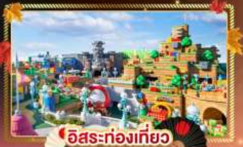
อิสระท่องเที่ยว