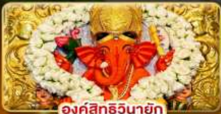
องค์สิทธินายัก