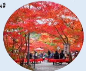
ที่ให้ภาพบรรยากาศท้องถื่นของลานหนึ่งสีแดง ที่ปกคลุมไปด้วยใบไม้เปลี่ยนสี