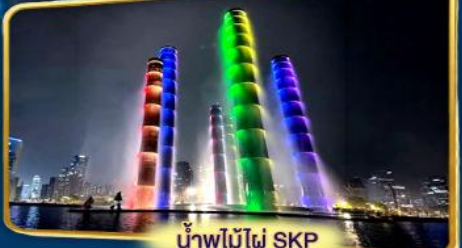
น้ำพุไม้ไผ่ SKP