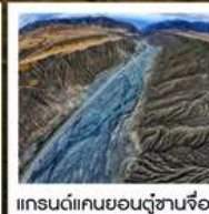
แกรนด์แคนยอนตู้ซานจือ