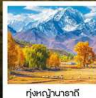
ทุ่งหญ้านาราที

ทัวร์คุณธรรม ไม่ลงร้านช้อปปิ้ง ไม่ขายออฟชั่น