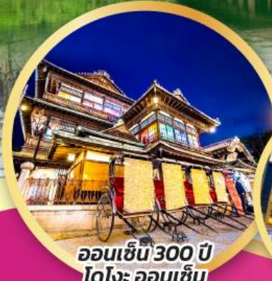
ออนเซ็น 300 ปี โตโจ ออนเซ็น