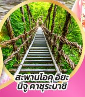
สะพานโอคุอียะ นิจู คาซุระบาชิ